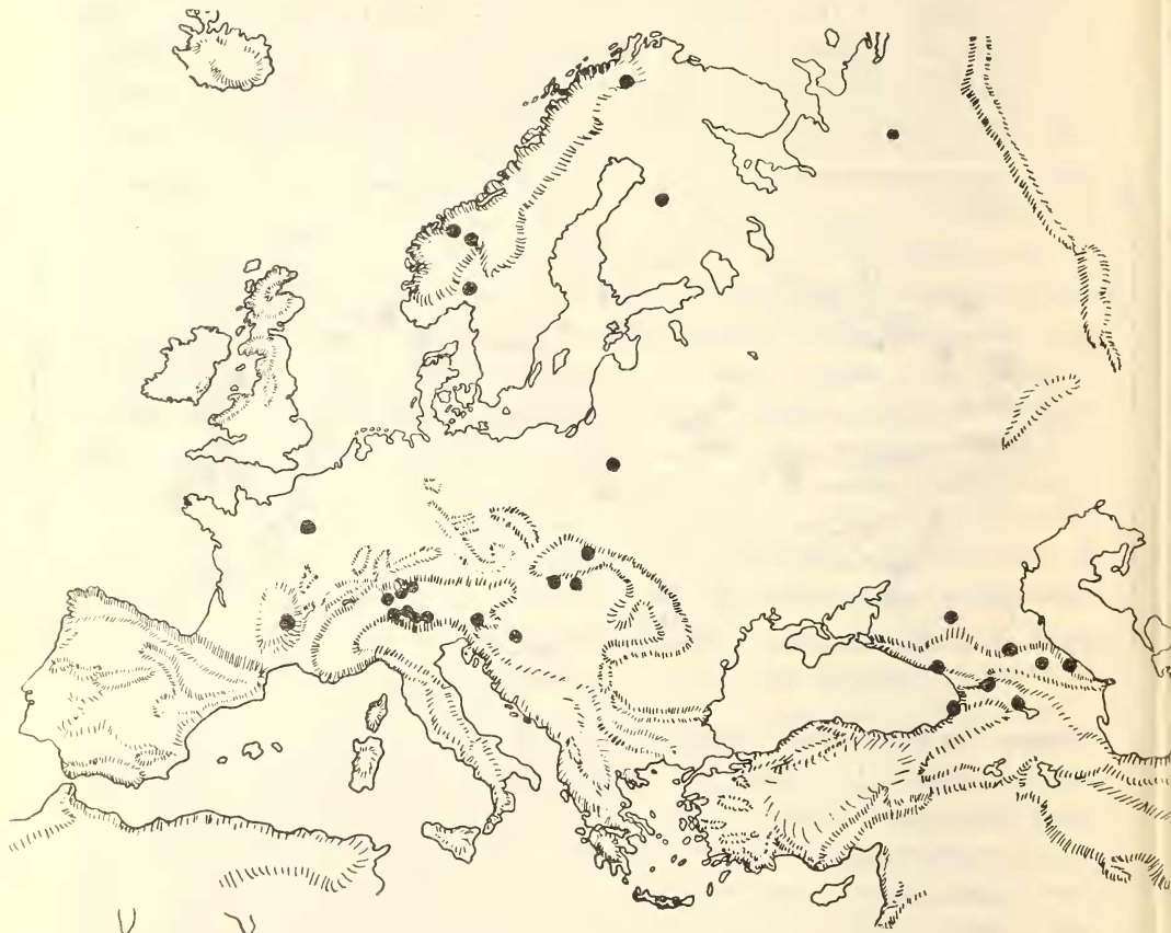
Abb. 2. Die europäischen Fundorte von Mustela minuta POMEL.

Material des Berliner Museums konnte ich feststellen, daß sich norwegische, finnische und litaunische minuta durch die gleichen Schädelmerkmale kennzeichnen wie sie POMEL für französische, CAVAZZA für alpine und CABRERA für spanische ( M. iberica ) Tiere angeben. Neben dem in erster Linie auffallenden Größenunterschied gegenüber nivalis und dem weiblichen Gesamthabitus der männlichen minuta -Schädel ist besonders die Ausbildung und der Verlauf der Sagittal-Crista charakteristisch (bei nivalis -♂♂ starke Crista mit erst in Höhe der postorbitalen Verengung gegabelten, und von Anfang an stark divergierenden Vorderästen, bei minuta -♂♂ schwach ausgeprägte Crista, die sich schon im Bereich der Parietalia